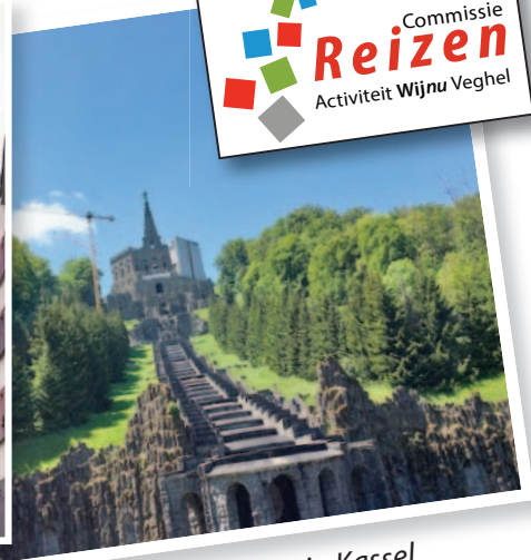
Wilhelmshöhe in Kassel