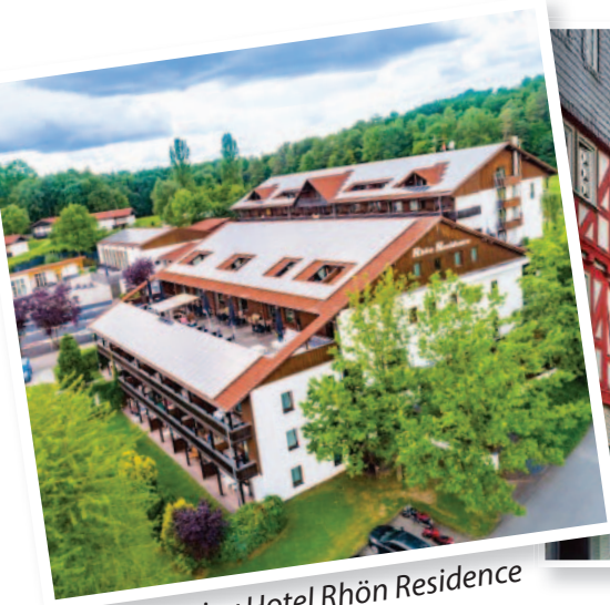
Enjoy Hotel Rhön Residence

In stad Dipperz (Hessen) in Duitsland van 18 t/m 22 mei 2025